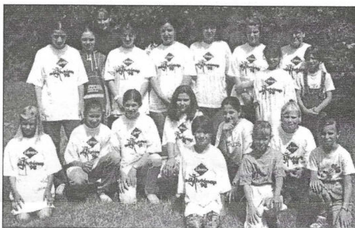
Az egyesület által rendezett sportnap résztvevői