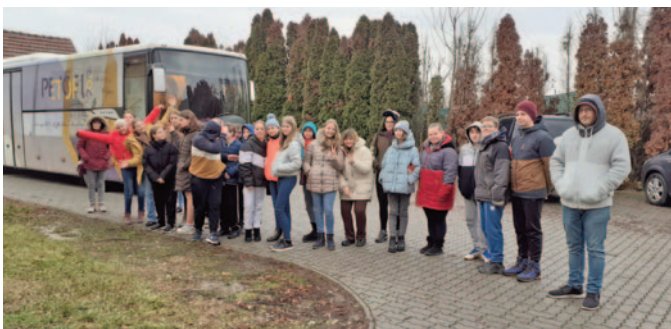
A 8. osztály a Petőfi-busznál