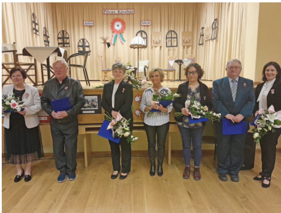
A Szigetbecse Községért Közalapítvány leköszönő kuratóriumának tagjai