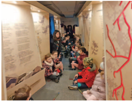
Az 1. osztály a buszban

A nap végén a busz utazott tovább a következő állomásra, Dömsödre. Március ele-