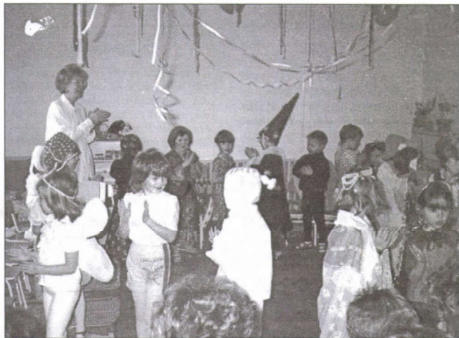
Farsang az óvodában