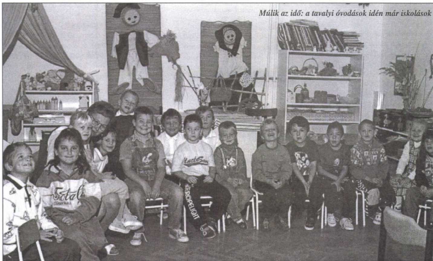
Múlik az idő: a tavalyi óvodások idén már iskolások