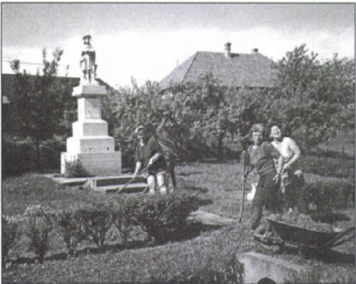
Parképítés – közösen