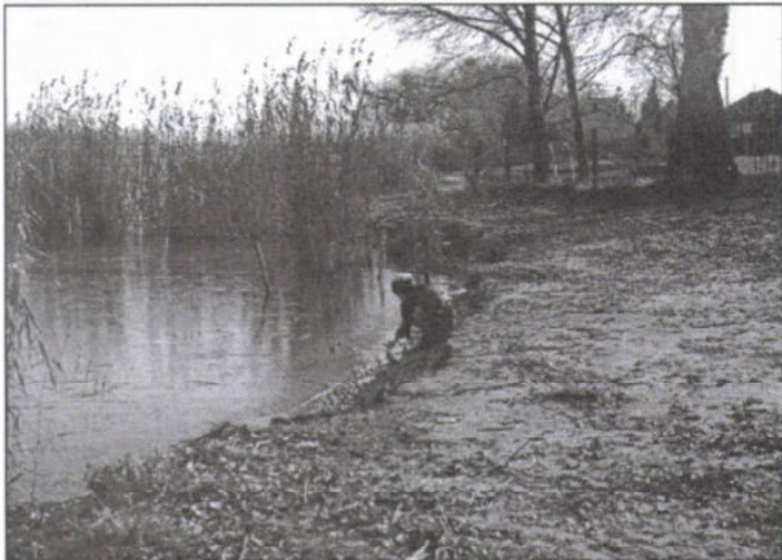
A strand-öböl feltöltött része

Újra elmúlt egy év, de ennek eseményeit már minden becsei polgár nyomon követhette a Szigetbecsei Krónikában. Ellenőrizheti mit ígértünk, terveztünk a 2000-es évre, mi valósult meg. Ahogy tavaly, úgy idén is szeretnék számvetést készíteni és ismertetem terveinket.