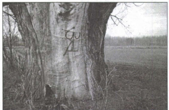
A megcsúfított fekete nyárfá