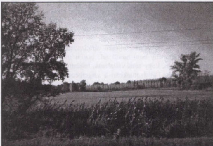
A még érintetlen rét nagy érték!

A beszámoló és Schuchmann úr ismertetője három órára elegendő mondanivalót adott az első műhelymunka résztvevőinek. Megfogalmazódott: a község nagy értéke és várhatóan felértékelődő kincse a szép környezete, a holtág, a sziget, a Duna-part, az erdők és a csend, a nyugalom. Eredeti állapotukba kell hozni a kis tavakat. Jó hír, hogy újra a község tulajdonába kerülhet, és így -