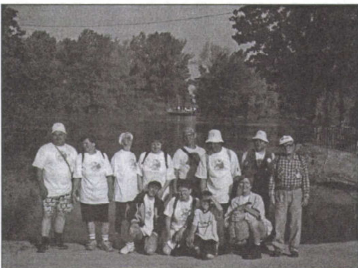
Európa-túrázókat a tiszai kompnál

Csoportunk távoli őseink gyakorlatát – és természetesen a megadott útvonalat – követve előbb a Maros, majd a Tisza kanyargós partján, gátjain gyalogolt. Bár nekünk sem a vízpart, sem a síkság nem jelentett újdonságot, mégis élveztük Dél-Magyarország táji szépségét, az árterek élővilágát, a hímes szőnyegként elterülő, vadvirágos rétek, gátoldalok pompáját. Hűségeken kísérték utunkon a virágzó galagonyabokrok, a bódító tavaszi illatok, a fáradhatatlan madárdalnokok és a békák hangversenye. Jó volt beszélgetve bandukolni, le-le térve az útról megtekinteni néhány helyi nevezetességet, műemléket, ismerkedni vendéglátóinkkal, egy-egy szakaszon csatlakozó turista társakkal.