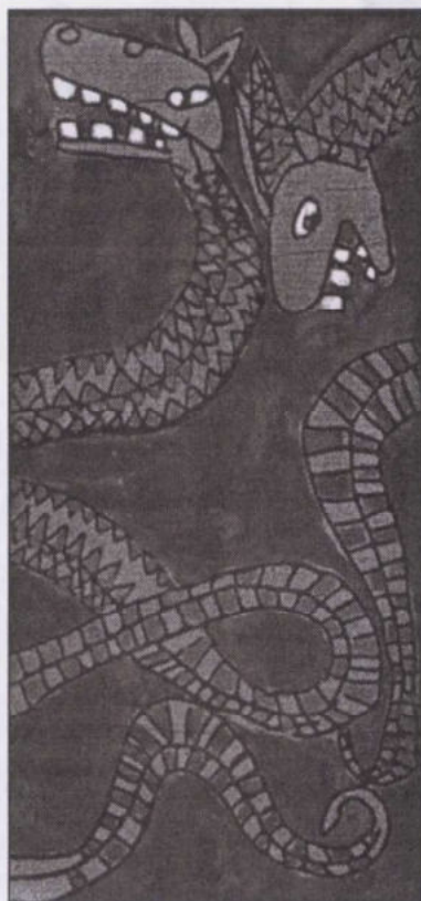
Küldőnő: Pálfalvi Anita (6. o.)

A költségvetés tartalék keretéből 100.000.- Ft-ot utalnak át két árvízkárosult község, Gulács és Kispalád megsegítésére.