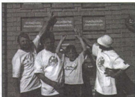
Ópusztaszer: „Megmaradás fala”

A táblatartó falak elhanyagolt, gondozatlan, gazos területen állnak, sok tábláról már most lekopott a felirat, a Szigetbecse tábla kettéváradva (megmaradás??) Méltatlan ez Ópusztaszerhez, a munkát megrendelő közösségekhez egyaránt!