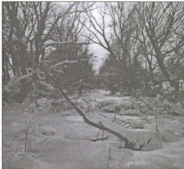
Tél a berekben

Régi típusú korcsolyákat vennék! 40-es mérettől. Tel.: 06-30-200-9304 Ráckeve Batthyányi köz 20.