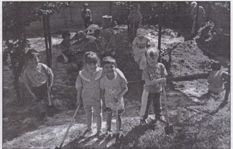
A homokozás játékos munka

Közben kiderül, hogy érheti az embert kudarc is – a kockatorony összedől, a rajzpapír elmaszatóldódik, a homoktorta nem sikerül. A kudarcot el kell viselni és megtanulható, átélhető az újrakezés. A kockatornyot új alapokon, más módszerrel újra lehet építeni, tiszta papírlapon már sikerülhet a rajz, a homokhoz több vizet kell gyúrni és a torta formás marad... Játék közben kiderül, hogy van, amit csak másokkal együtt lehet sikeresen megoldani. Konfliktusok keletkeznek, tanulni kell, hogyan lehet ezeket feloldani.