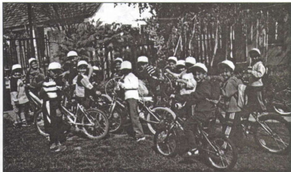
A szigetbecsei óvodások túrára készülnek