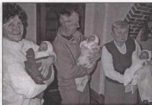
A boldog nagyszülők

a tervezett nagycsalád igényeit kielégítse. A hármas boldogság még így is okoz némi gondot. A babaszoba ugyancsak zsúfolt, hiszen a mama ágya mellett helyet kellett szorítani mindjárt három kiságnak, a pólyázó asztalnak és sok kis ruhának, pipere holminak.