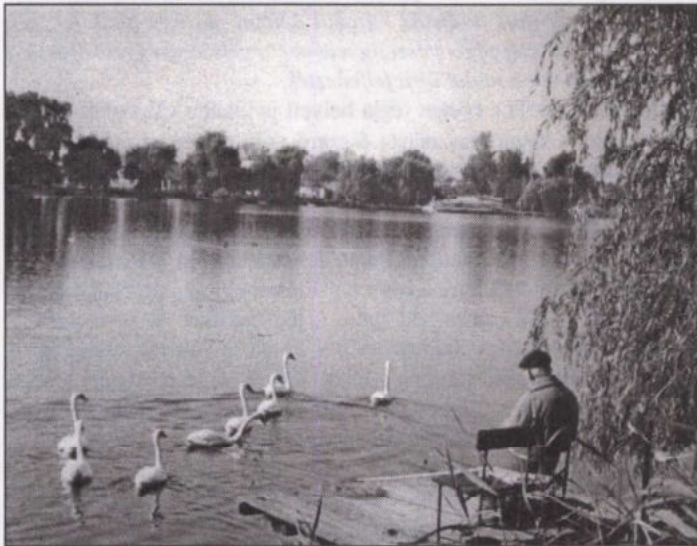
Horgásziidill a Ráckevei-Dunán