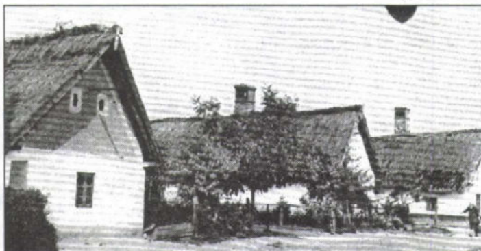
Jellegzetes falukép a múltból