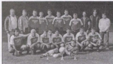
A felnőtt csapat

Szigetbecse felnőtt és ifjúsági csapata egyként sok örömet szerzett a szurkolóknak, a támogatóknak, mert mindkét együttes nagyszerűen szerepelt! A Szigetbecsei Sportegyesület a közel-múltban ünnepelte 50 éves fennállását. Fél évszázad alatt a labdarúgó szakosztály folyamatosan működött, azonban egyszer sem fordult elő, hogy községünk labdarúgói jogot szereztek volna a megyei II. osztályban való szereplésre.