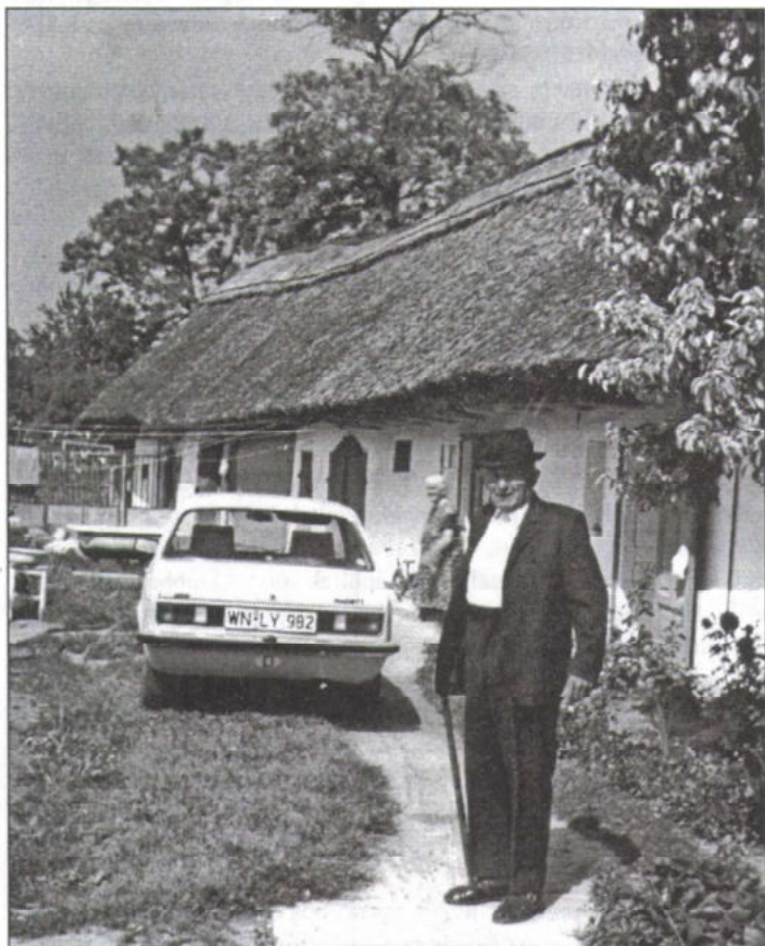
A szülői ház – már lebontották...

Nem kell ahhoz öregnek lennünk, hogy emlékezzünk falvaink jellegzetes utcaképeire, a nádfedeles házak sorára. Kedvelt, olcsó építőanyag volt a nád a folyószabályozás előtt vizek járta, zsombékos Csepel-sziget településeiben is. A nádazáshoz – bár ehhez sem lehet csak úgy hűbelebalázs módján nekifogni – egy faluban sokan értettek, de kiváltak közülük a mesterek, akik aztán keresettek voltak az építkezők körében.