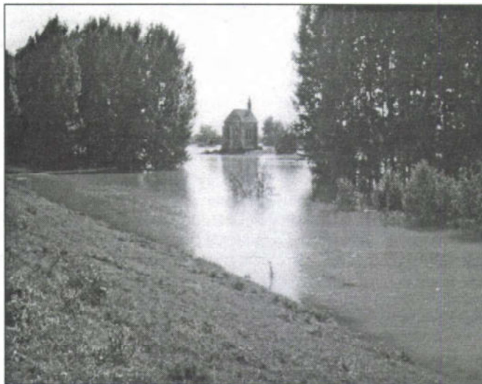
A Zichy-kápolna a víz fogságában