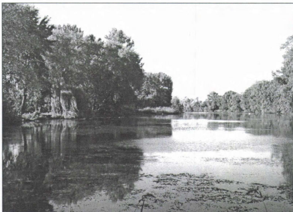
A szigetbecsei holtág. A község küzdő birtoklásáért