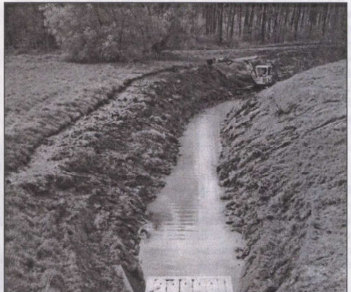
Dolgozik az árokásógép

Minden lassan folyó víz közös sorsa, hogy a vízpótlással érkező hordalék lerakódik, a víz holtággá válik, idővel teljesen feltöltődik. Az említett haszonélvezőkön kívül ellenérdekelt ebben maga az élővilág. Minden romlás ellenére itt még sok szépség, növényi, állati