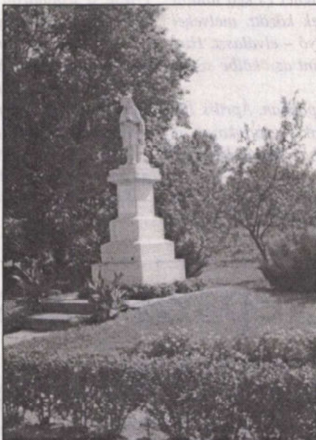
Jó példa: a Szent Vendel szobor körül rendezett, virágos park.

A fejlesztések közül külön szólt a Makádi út felújításáról, jelezve, hogy a padka kialakítása még hátra van. Tavaly megkezdődött három park fejlesztése, illetve kialakítása, de a további munkálatokkal meg kellett várni a szennyvízcsatorna kiépítésének befejezését. Idén az elkészült tervek szerint elvégzik a munkát, elhelyezik az ugyancsak korábban elkészült üdvözlő és tájékoztató táblákat, hulladékgyűjtőket.