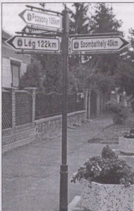
Ez volt a minta

egyik pályázatunk az utca- és információs táblák elhelyezésére szült. A táblákat megrendeltük, várhatóan augusztus hónapban elkészülnek és Szigetbecse Makádi út kereszteződésében elhelyezésre kerülnek.