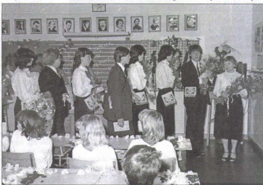
Itt egy osztálya búcsúzik...