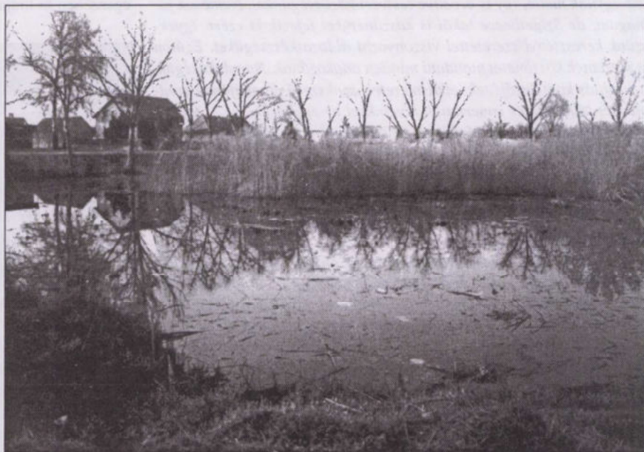
1999-ben még volt egy kis víz a tóban

Amennyiben a kiegészítő vizsgálat eredményes, a tervet be lehet nyújtani engedélyezésre a vízügyi igazgatósághoz, az engedély birtokában pedig az önkormányzat benyújthatja pályázatát a tó újraélesztésére.”