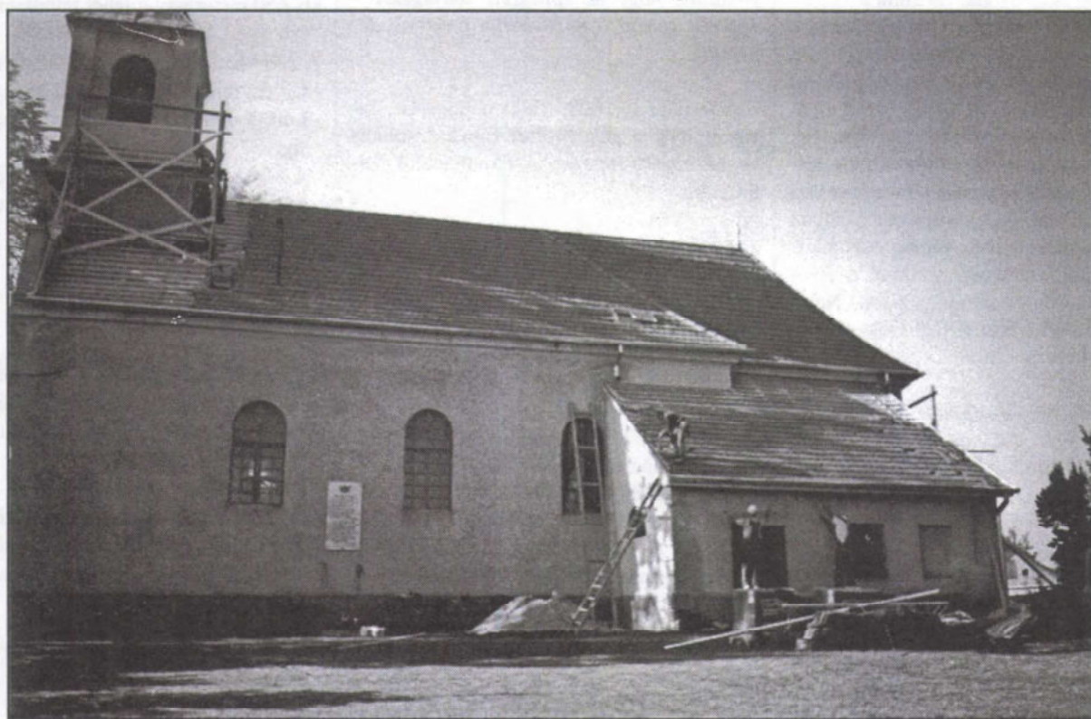
A templom védőszentje, Szent Mihály tiszteletére tartott búcsún már készen állt a felújított templomtető