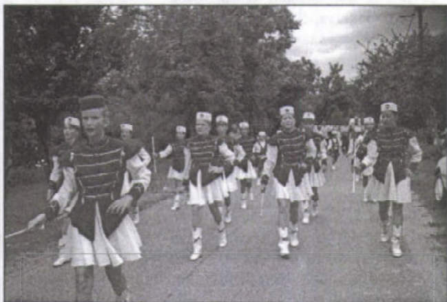
A nyitány: a Ráckevei Mazzorett Együttes felvonulása

A rendezvényhez csodálatos környezetet biztosított a Duna, a strand. A multság délután 1 órakor vette kezdetét a faluban a ráckevei mazzorett csoport felvonulásával. A kislányok gyönyörűek voltak, a produkció magával ragadott minden nézőt. 2 órakor kezdődött a Dunaparton a főzőverseny, melyre előzetesen beneveztek a résztvevők. 18 bográcsban