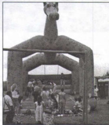
Gyerekek öröme az ugrálóvár