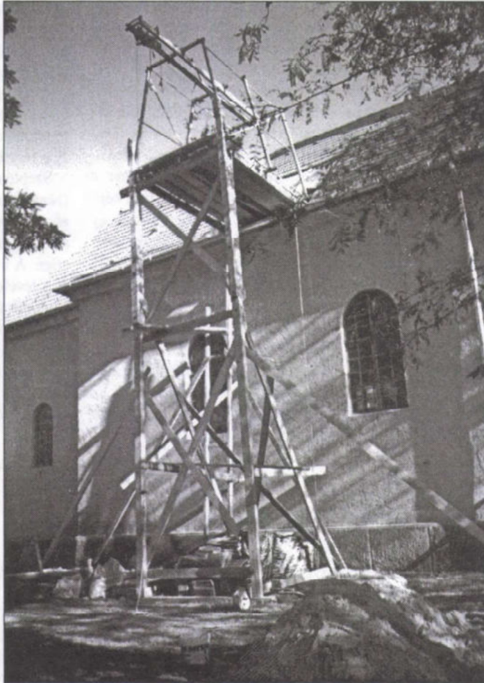
A munka folyamatában

A benyújtott végszámlát a szigetbecsei egyházközség teljes egészében ki tudja elégíteni.