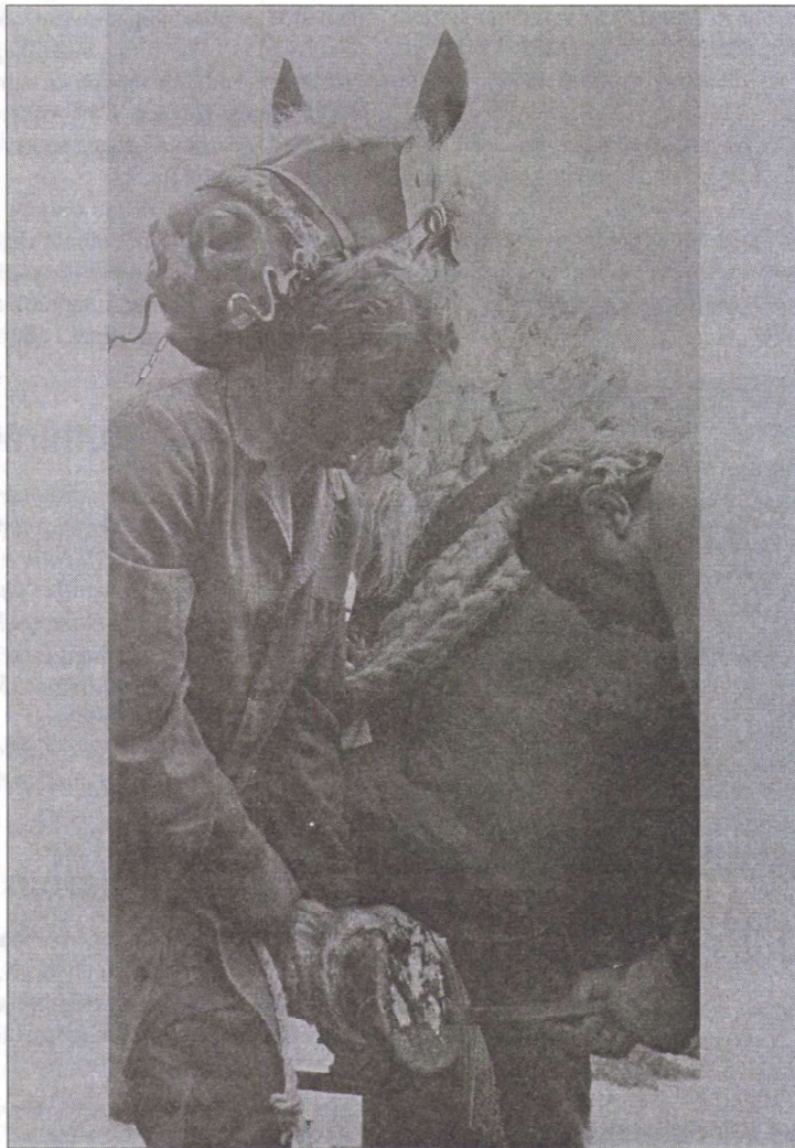
A mester munkában

A számítógép nagyszerű találmány, ismerje meg minden fiatal, de nem feledtetheti az apák, a nagyapák életét, tudását, mesterségét!