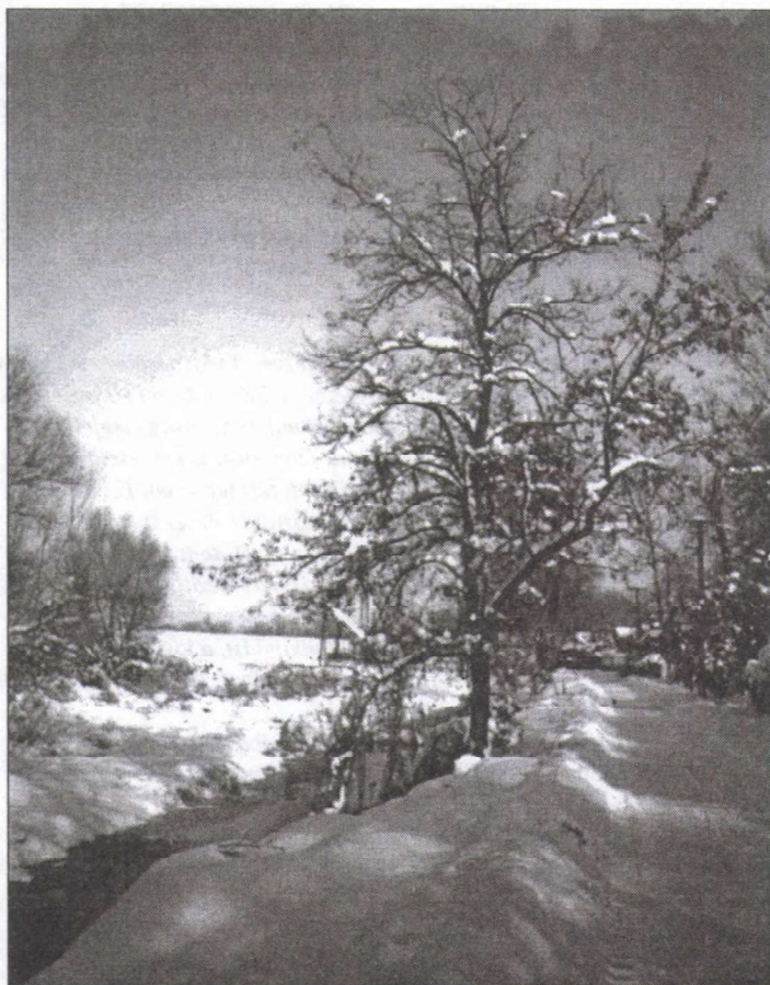
Téli tájkép Szigetbecsén