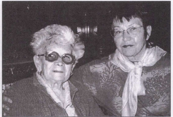
„Für meine liebe tanító néni”