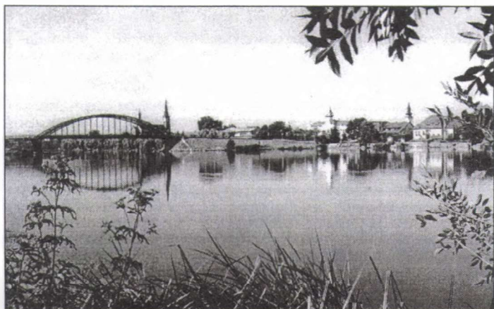
„...ez a szép folyó – beteg...”

„Egy nemzet akkor jár el tisztességesen, ha kincsként kezeli a természeti erőforrásokat és megnövelt értékben adja át a következő generációnak.”