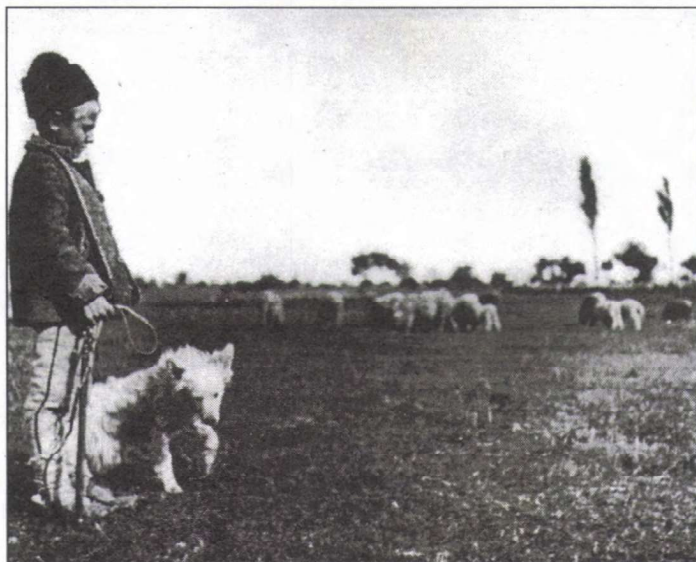
A becsei kisbojtár (Szigetbecse)

Ma, amikor ezer éves állami ünnepünkkel ünnepeljük az őseinkről, amikor öröm és büszkeség tölt el bennünket sportolóink olimpiai sikerei nyomán, idézzük fel hálával és tisztelettel egy híres fotóművész emlékét, aki megismertette Szigetbecse nevét a világgal.