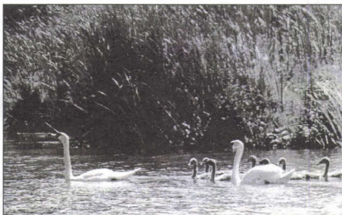
„...Őrizedők volnának természeti értékei...”