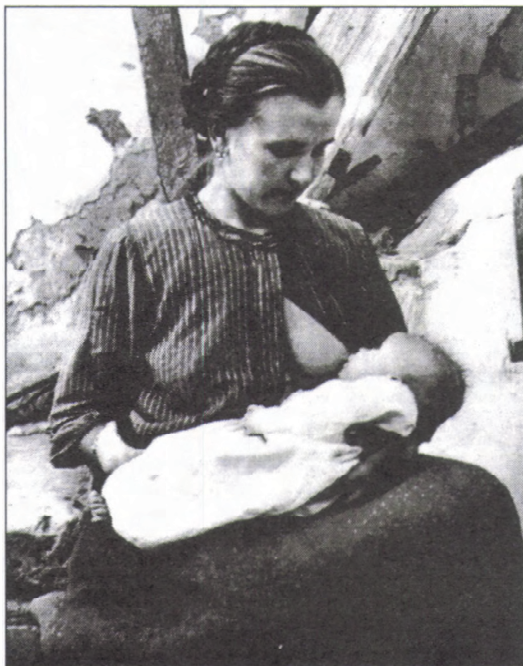
Falusi Madonna (Szigetbecse)

Szigetbecsét mindig felkereste, amikor Magyarországon járt. Utoljára 1984 júliusában látogatott el a faluba, elzarándokolt a becsei tóhoz, itt készítette utolsó magyarországi képét. Kiválasztott egy házat – régi parasztház, az udvarán gémeskút – és azt mondta: „Ide 50 fotó kell.” 1985-ben jött a távirat: „Jönnek a képek.” végül 120 fotó érkezett. André Kertész még abban az évben 91 éves korában meghalt – idegenben.