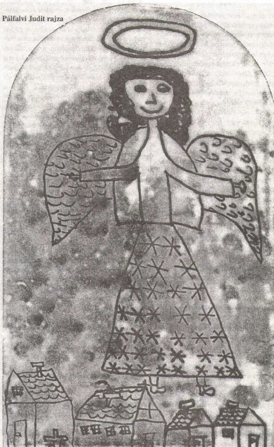
Pálfalvi Judit rajza