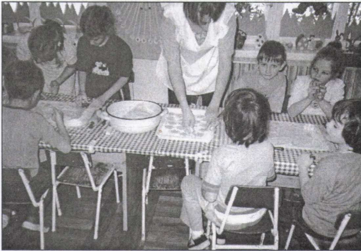
Készül a húsvéti sütemény

Ezután izgatottan, örömmel kukucskálnak az ablakon, és felöltözködés után jöhet az udvaron a keresgélés. A talált édességeket kosarakba gyűjtjük, amiből hazainduláskor mindenki vesz, az új játékokkal pedig önfeledt játékba kezdenek. Csodálatos érzés látni a boldogságtól csillogó gyermekszemeket, az örömtől sugárzó arcokat. Ez olyan felejthetetlen élmény, hogy a nagyobbak még arra is emlékeznek, hogy tavaly milyen játékokat találtak a fészkekben. Az öröm ilyen formában csak akkor teljesülhet be, ha az időjárás kedvez nekünk.