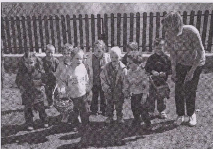
Keressük az ajándékokat

Öröm. Az öröm az egyik legkorábbi és az egyik legfontosabb emberi érzelem. Mi az óvodában naponta találkozunk az örömmel. Örülni minden apró dolognak is lehet. Öröm, ha a kiscsoportos gyermek már nem sír, feltalálja magát új környezetében, kialakulnak szokásrendszerei, megtalálja a neki kedves tevékenységet, együtt játszik az óvó nénivel, újdonsült társaival. Egy érett kiscsoportos általában egy hónap múlva már örömmel jön az óvodába. Ehhez természetesen az kell, hogy figyeljünk a gyermekekre, megismerjük és elfogadjuk őket olyannak, amilyenek, feltétel nélkül. Rá kell éreznünk, hogy mi az, ami megnyugtatja őket, hiszen tőlünk várják el, hogy szeressük őket, és akkor erre örömmel válaszolnak szeretetükkel.