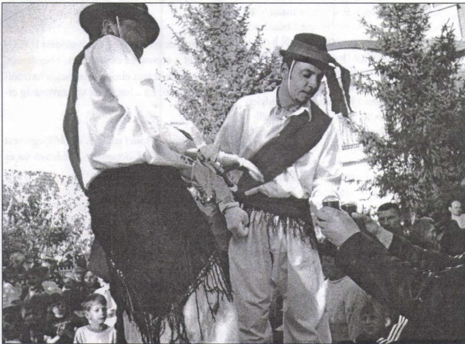
„Bemelegítés” futás előtt

Kedves olvasóinknak kellemes húsvéti ünnepeket kívánunk!