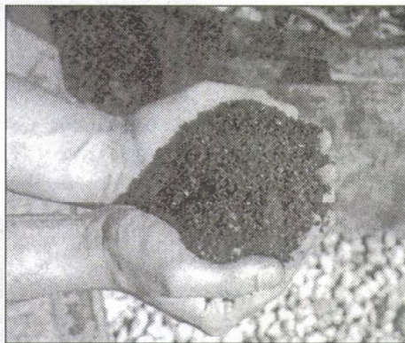
A kész komposzt

Hatalmas feladatot ró ez a jogalkotókra, kormányokra, hivatalokra, de mit tehet az egyén, a kisközösség?