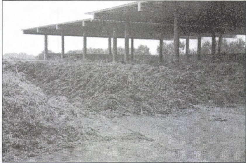
Az érlelés prizmákban történik

lóban való tárolás, illetve az égetés bizonyult. Miután csatlakoztunk az Európai Unióhoz, számunkra is elsősorban érdekes, hogy ebben a közösségben már sokat tettek a szelektív hulladékgyűjtés, ezen belül a szerves anyagok elkülönített gyűjtése, kezelése terén.