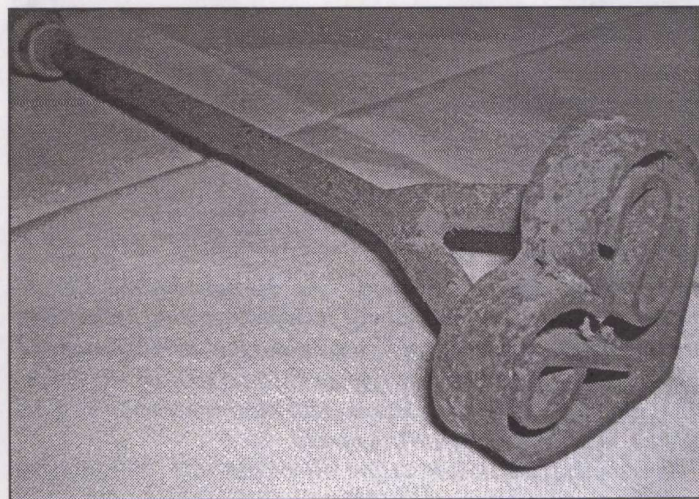
A nagypa billogja

Vannak itt tárgyak, melyeket a mészárosok, a szőlőtermesztők vagy a háziasszonyok használtak: mérlegek, szakajtók, mángorlók, metszőollók. Látván ezeket, vajon tudnák-e a mai gyerekek, hogy mire használták és hogy működött pl. a héber, a gereben, mit tartottak valamikor a tülökből készített tokban és mi volt a billog?