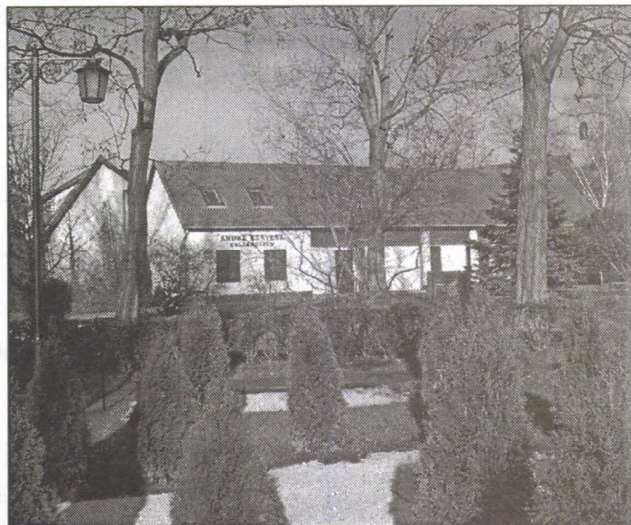
↑ Az André Kertész Emlékmúzeum tavasszal tovább szépül