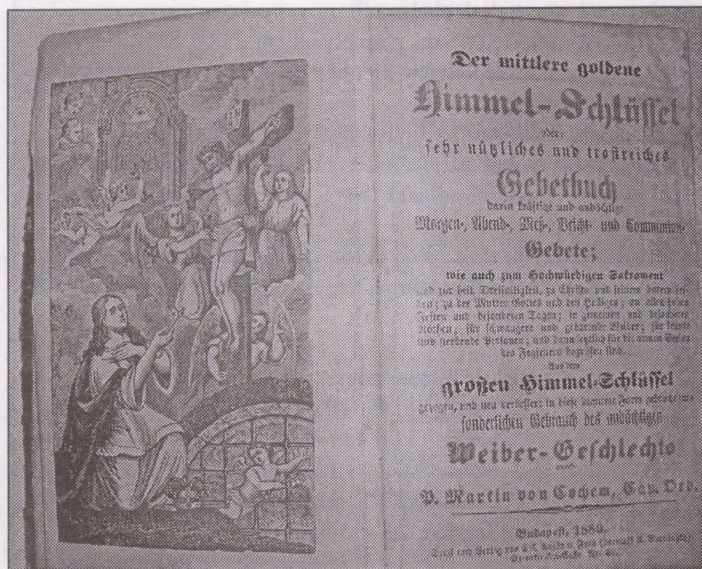
„... nagyon hasznos és vigasztaló” imakönyv