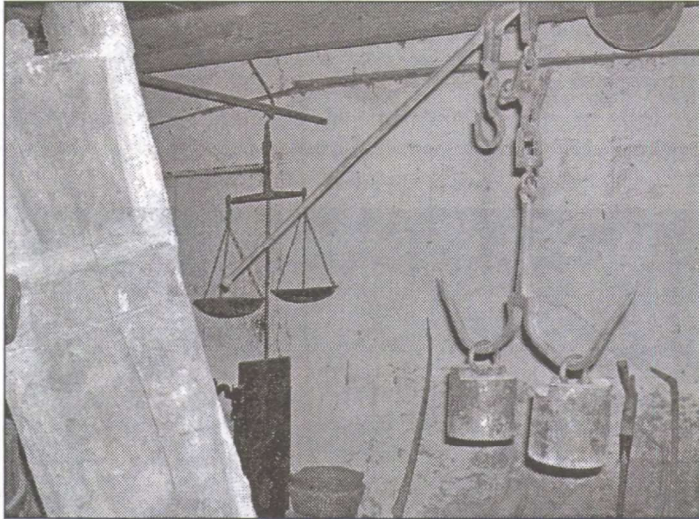
Mérlegek egyelőre raktárban