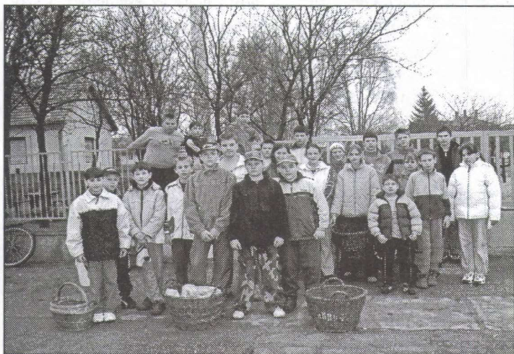
A gyűjtő csapat