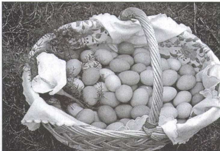
A fő kellékei: a tojások