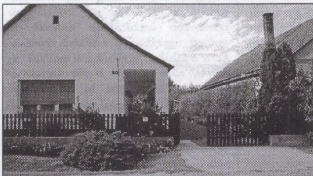
A szépek között legszebbek: