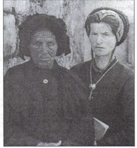
Anyja és lánya a franciaországi Szavójából

„André Kertész, aki 1925-ben hagyta el végleg Magyarországot, s költözött Párizsba, 1931-ben Szavójában, a korai magyar képein már megszokott látásmóddal, humanizmussal fényképezte az arató, tyúkokat etető, teheneket fejő, kaszáló és más házkörű munkákat végző szavójai parasztembereket, miként néhány évvel korábban a tiszaszalkai, szigetbecsei, abonyi vagy esztergomi sors társait. Az eddig jórészt ismeretlen képek a legtermészetesebben kötik össze Kertész magyar és francia alkotó periódusát. A 2004-ben Franciaországban Savoie d'André Kertész címmel kiadott albumban valamennyi ekkor készült kép együtt szerepel. Nem kis büszkeséggel közölhetjük: Magyarországon elsőként a Magyar Fotográfiai Múzeumban láthatók Kertész életművének alig ismert alkotásai.”