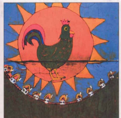
Bak Norbert – 11 éves