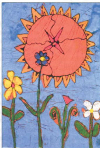
Wágner Bernadett – 7 éves