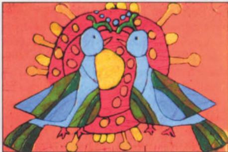
Schmidt Szilvia – 9 éves