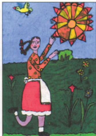
Fási Luca – 7 éves