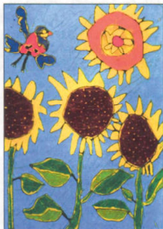
Bohák Kornélia – 8 éves