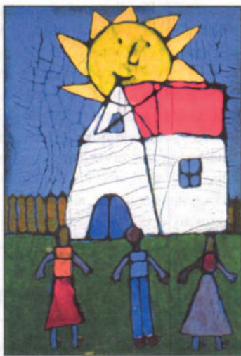
Simon Bernadett – 7 éves