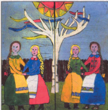
Mihály Eszter – 13 éves