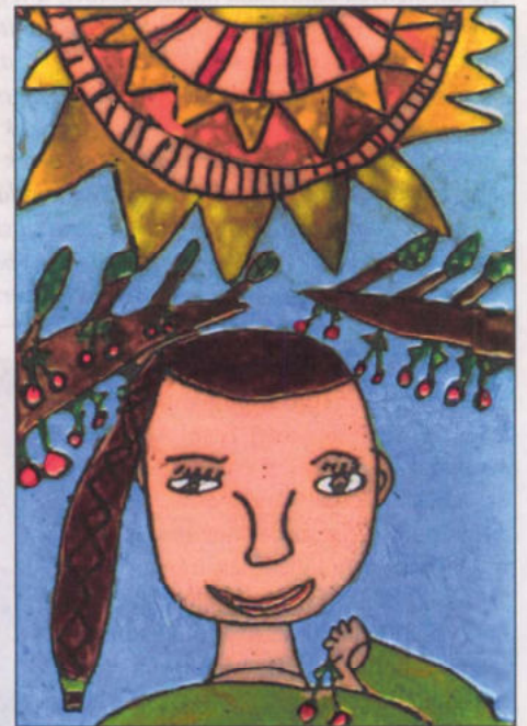
Tapodi Kinga – 9 éves