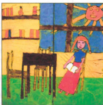
Mészáros Zsófia – 10 éves