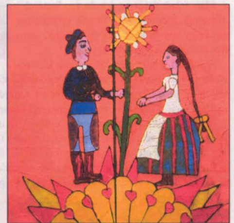
Glöckl Nóra – 10 éves