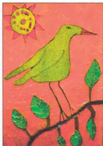
Bak Emese – 7 éves