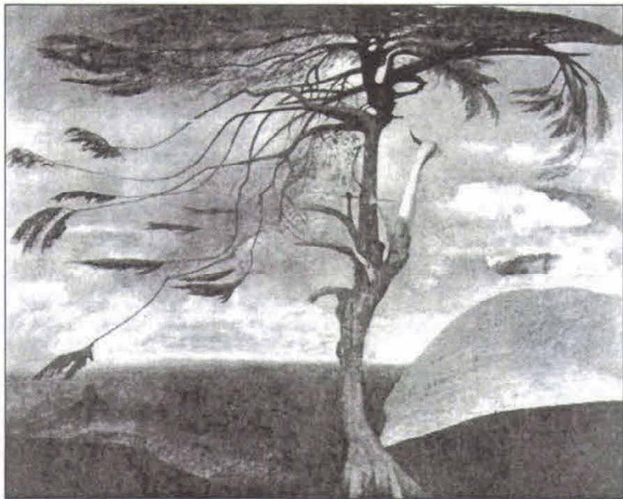
Csontváry Kosztká Tivadar: Magányos cédrus

E lanyagiasodott világunkban halványodnak, gyorsan eltűnnek távoli őseink életét, gondolkodását tükröző kifejezések, szokások, motívumok. Talán használjuk ezeket, de eredetükről már keveset, vagy semmit sem tudunk. Hallottam egyszer egy népművészetről híres vidék hírnő-asszonyától, hogy egy hagyományként őrzött virágmotívum közepén hét vágást kell hímezni. Kiderült, hogy ez annak emléke, hogy eleink sámánja amikor szólt az emberekhez, emelvényére a rítushoz tartozó hétfokú létrán ment föl. A sámán létra pedig az égi lajtorja – égi