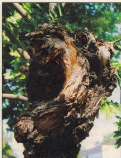
Darabont Mária: Kiáltás

Kezdetben volt az André Kertész Múzeum, mely 1987. május 30-án nyílt idősebb Raffay Béla kezdeményezésére. Majd következtek annak kistermében rendezett kiállítások. Idén először a Szigetbecse Községet Közalapítvány támogatásával és kezdeményezésére, amatőr fotópályázat hívta a fotózás iránt érdeklődőket, hogy mutakozzanak be alkotásaikkal.