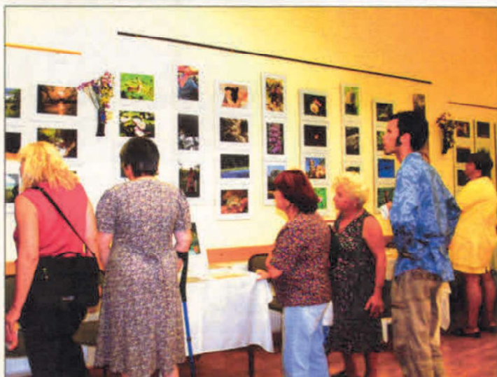
A kiállítás látogatói