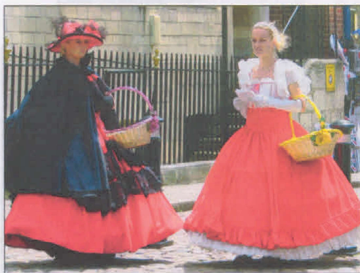
Lumei Sándor: Kosaras kisasszonyok