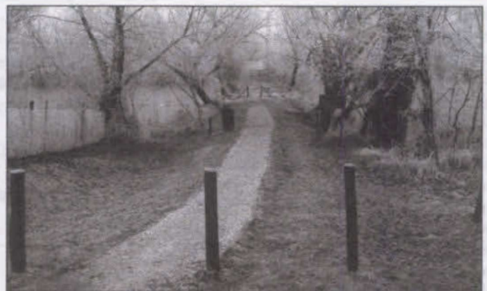
A tanösvény télen

Kiadja Szigetbecse Képviselő-testülete, Felelős szerkesztő: Pap Kornélia, Felelős kiadó: Losonczy Béla jegyző.