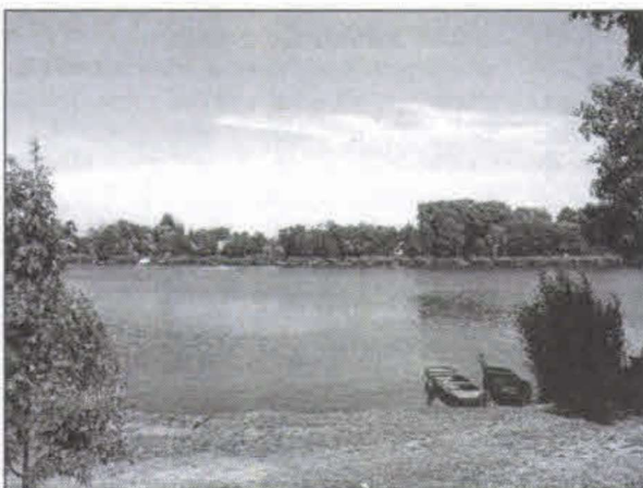
Legyen tisztább a ráckevei Duna!

Az érintett 14 település egyike Szigetbecse, melynek képviselő-testülete megtárgyalta és elfogadta az RSD Parti Sáv Önkormányzati Társulási megállapodást és a társulás alapító okiratát.