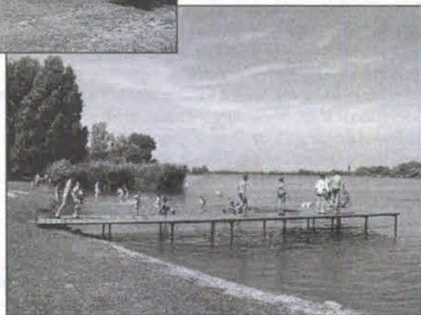
Kánikulában a szigetbecsei strandon