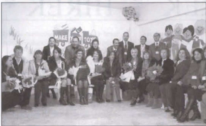
A négy ország képviselői