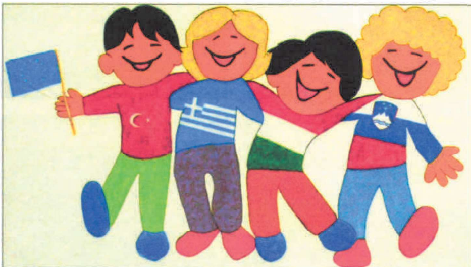
Résztevő országok (Törökország, Görögország, Magyarország, Szlovénia)