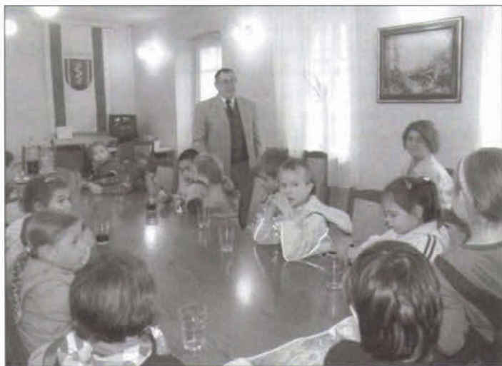
A Polgármesteri Hivatalban

Szigetszentmárton – Szigetbecse. Mindkét falu a Csepel-szigeten, a Kis-Duna közelében található. Természeti adottságaik hasonlóak. Mindkét település várja a turistákat, nyaralókat. A Dunában lehetőség van a horgászatra, fürdőzésre. Bár a víz közelsége a régi időkben nem mindig jelentett jót, hiszen a szabályozás előtt gyakoriak voltak az árvizek, így nem csoda, hogy Nepomuki Szent János szobra mindkét faluban helyet kapott: Mártonban a templomban, Becsén a holtág partján. A két templom között egyébként érdekes kapcsolat van: a mártont Krisztina főhercegnő, a becseit Albert herceg segítségével építették. Ők ketten pedig feleség és férj voltak. A Habsburg család tagjai a különböző harcok során megüresedett falvakba betelepítették.