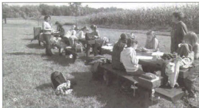
A Tözike Tanösvény pihenője

Rendezett, gondosan ápolott parkokban bővelkedő, látnivalókban gazdag települést ismerhettek meg a szigetszentmártoni kisiskolások. Amerre mentünk, mindenütt nagy szeretettel, törődéssel fogadtak