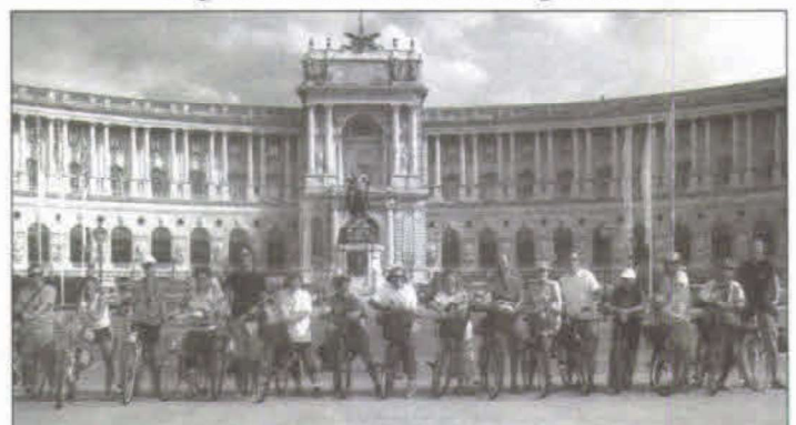
Passau – Bécs két keréken. Végállomás