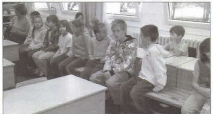
Szigetszentmártoni iskolások látogatóban