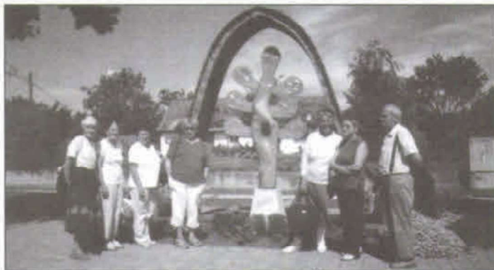
Budapesti nyugdíjasok az Életfánál