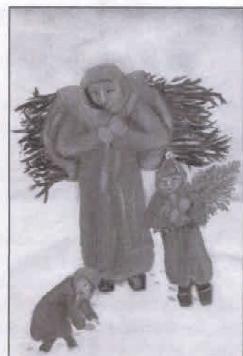
Az élet így is szép