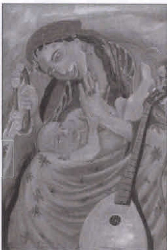
Örömök és érzelmek – Madonna