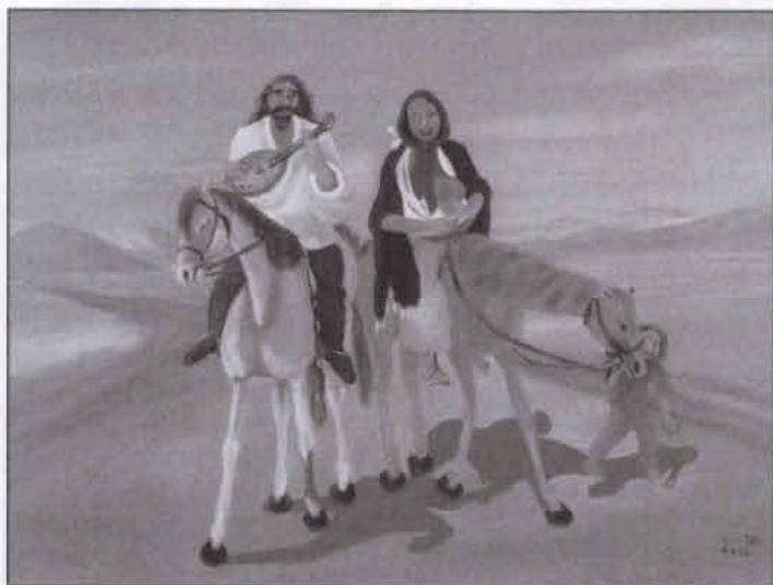
Az út vidámjai