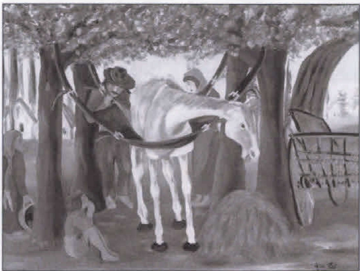
A legyengült gebe