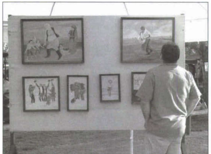
Szigetbecsei falunapi kiállítás