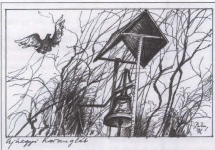
Patay László grafikája