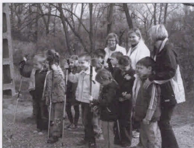
Vendégvárosi becsei óvodások

Vallási turizmus ilyen értelemben régóta ismert résztvevői éppen úgy lehetnek hívők, mint a kultúra, a történelem iránt érdeklődők.