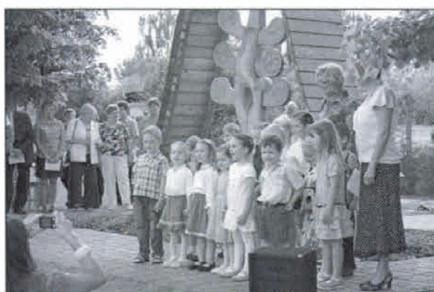
... óvodások műsora