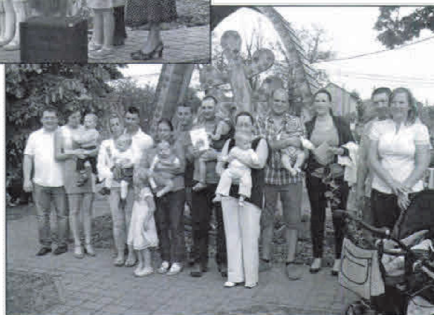
... az ünnepeltek