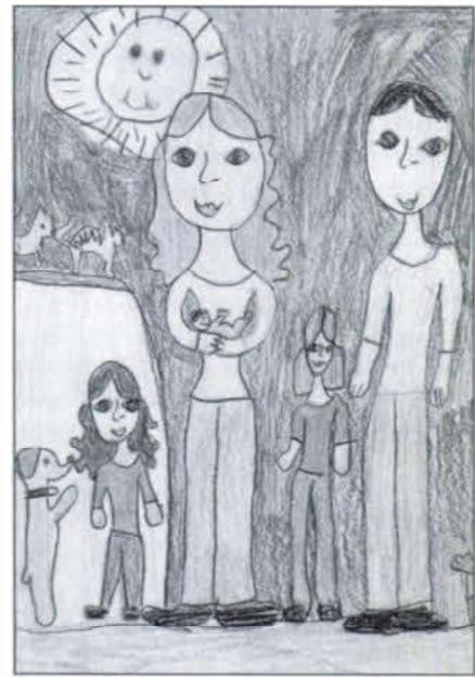
Grill Hajnalka 2. osztály