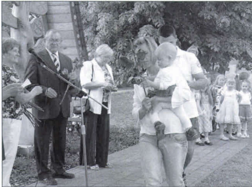
Életfa: Anyák napja

(A „Képviselő sarok” sorozatot folytatjuk.)